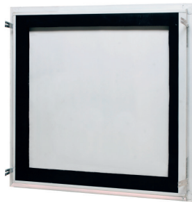
Bevizsgálva 600 x 600 mm méretig

A „por- és légmentesen záródó“ és a rozsdamentes kivitel is.